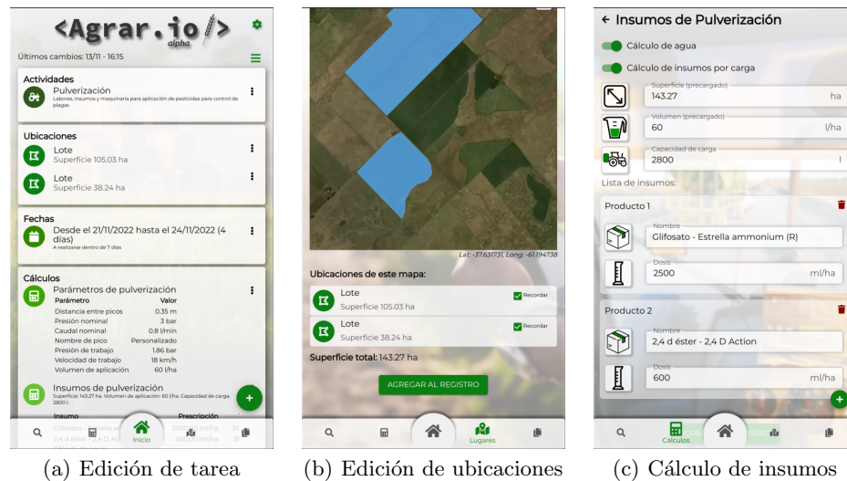
Figura 2. Capturas de pantalla de la aplicación

La interfaz gráfica de usuario (GUI, por sus siglas en inglés) se implementó con la ayuda de React y MUI 11 . Estas herramientas de código abierto proveen una lista de componentes de propósito general listos para usar, como botones, menús, formularios, entre otros. Además se incluyó una lista de íconos predefinidos 12 , reduciendo el costo de diseño gráfico.